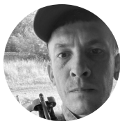
Іван Симоновський військовий