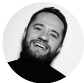
Роман Єременко фотограф