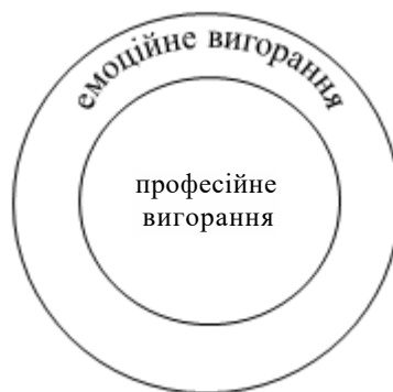
Рис. 1. Емоційне та професійне вигорання

Емоційне вигорання розглядають у сучасній науці як специфічний стан психічного виснаження, що проявляється у стійкому зниженні емоційної залученості, відчутті втоми, цинічному ставленні до професійних обов'язків, у переживанні власної неефективності. Деякі дослідники ототожнюють його з професійним вигоранням. На нашу думку, це не зовсім вірно, адже поняття «емоційного вигорання», що розвивається на фоні довготривалого виснаження вегетативної нервової системи (ВНС), є набагато ширшим за своєю суттю та може стосуватися різних сфер життя людини, у той час як «професійне вигорання» є його різновидом, спричинений довготривалим, тобто хронічним стресом, пов'язаним саме з її професійною діяльністю (Рис. 1. Емоційне та професійне вигорання). Схематично це виглядає приблизно так: