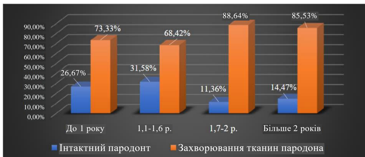
Рис. 1. Стан тканин пародонту у військовослужбовців залежно від терміну тривалості перебування у зоні бойових дій

Військовослужбовці, які проходили лікування та військово-лікарську комісію у Запорізькому військовому госпіталі ВЧ 3309 з січня 2022 по травень 2024 року, були об'єктом дослідження. Аналізувалися рівні кортизолу та інсуліну, визначені за допомогою лабораторних тестів. Оцінювався стан здоров'я зубощелепної системи за допомогою стоматологічних оглядів та рентгенографії, а також загальносоматичне здоров'я за клінічними та лабораторними показниками.