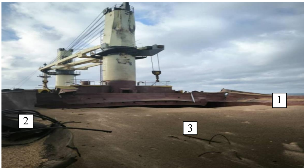
Рис. 2. Вид трюму № 3 з повністю відірваними кришками, з зерном у стані фумігації фосфіном (1- повністю зруйнований комінгс, 2- фрагмент відірваної кришки, 3-видкрита поверхня горілого від вибуху зерна, з якого постійно виходить отруйний газ фосфін, вибухові та пожежні газы)

- по-п'яте, усі видимі поверхні вантажної палуби лівого борту покрити шаром викинутого вибухом горілого зерна чорного кольору.