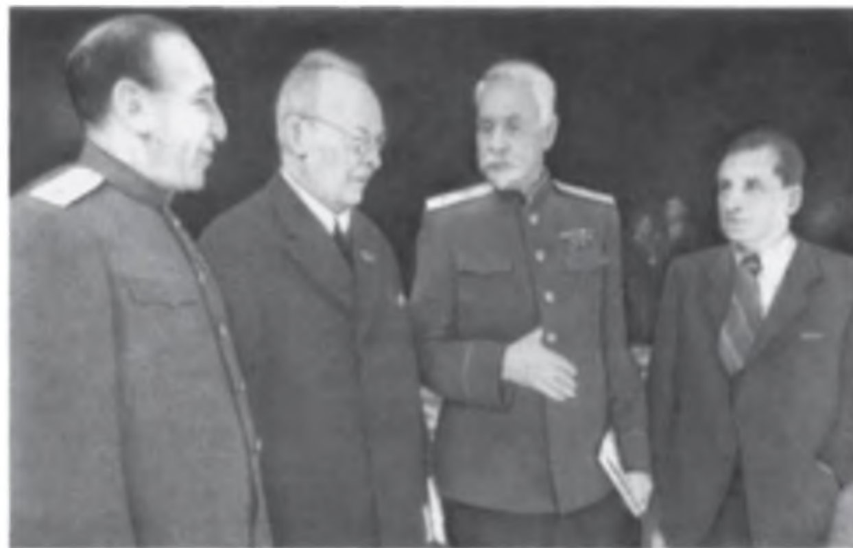
Рис. 3. Выдающиеся терапевты — члены Академии медицинских наук СССР: М. С. Вовси, Г. Ф. Ланг, М. И. Арикин, В. М. Коган-Ясный